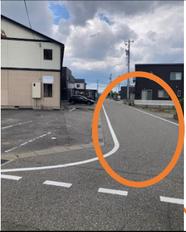
①コーポタカオ前道路